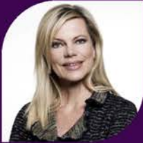
Nina Ruge TV-Moderatorin, Autorin, Journalistin, u.a. Botschafterin der Felix-Burda-Stiftung für Darmkrebsvorsorge